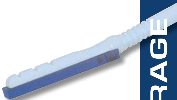
Retouche de glissière de machine